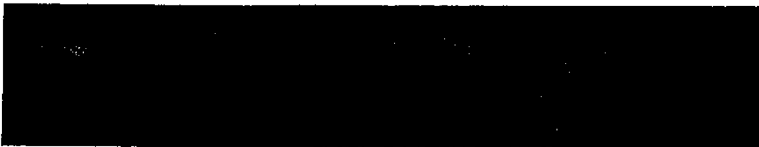
Alger Bouzaréah. Composante EW -- 25 Août 1922